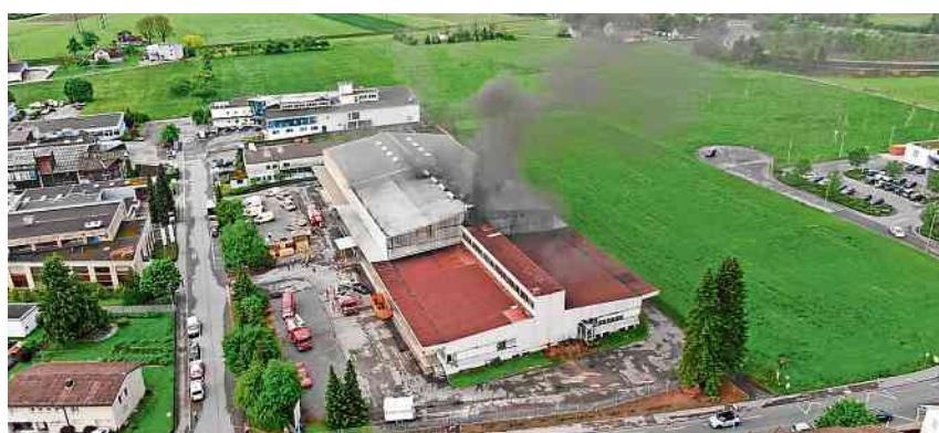
Bei der Halle kam es zu einer massiven Rauchentwicklung. kapo

Uznach Ein Angestellter der registrierten CBD-Hanfanlage betrat die Halle und stellte die Lüftung ein. In diesem Moment brach die Kon-